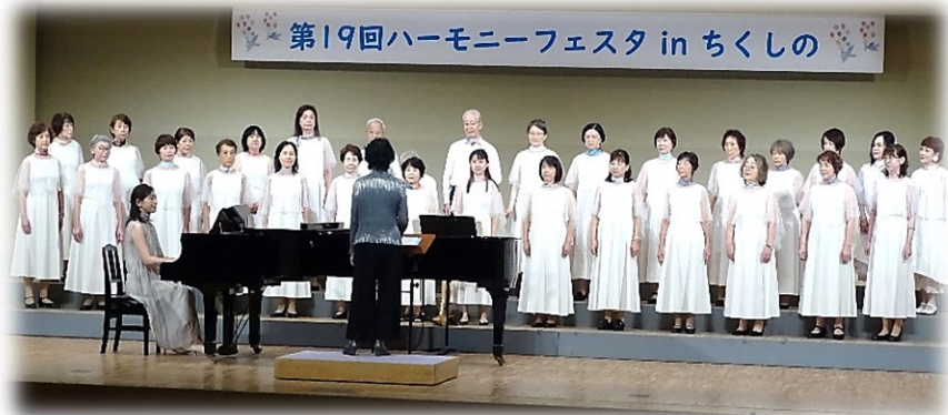
ニコ協域内からの出演団体「天拝坂混声合唱団」