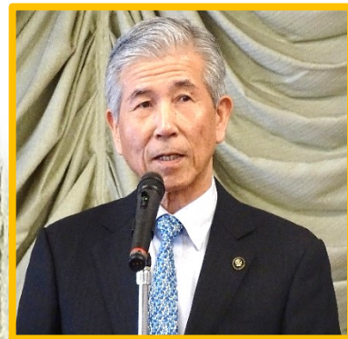
平井 一三 筑紫野市長 の祝辞