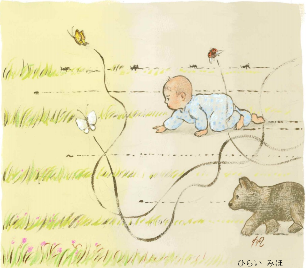
3月 一斉に虫たちが動きだす これを けいちつ 啓蟄と言うらしい おや 虫じゃないのも動きだした