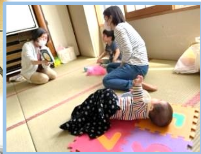
毎月1回実施する「読み聞かせ」

これからも、お子さんとママ・パパと一緒に楽しめるように、一年を通して四季折々の催事をセットし、夏にはプールの準備をします。