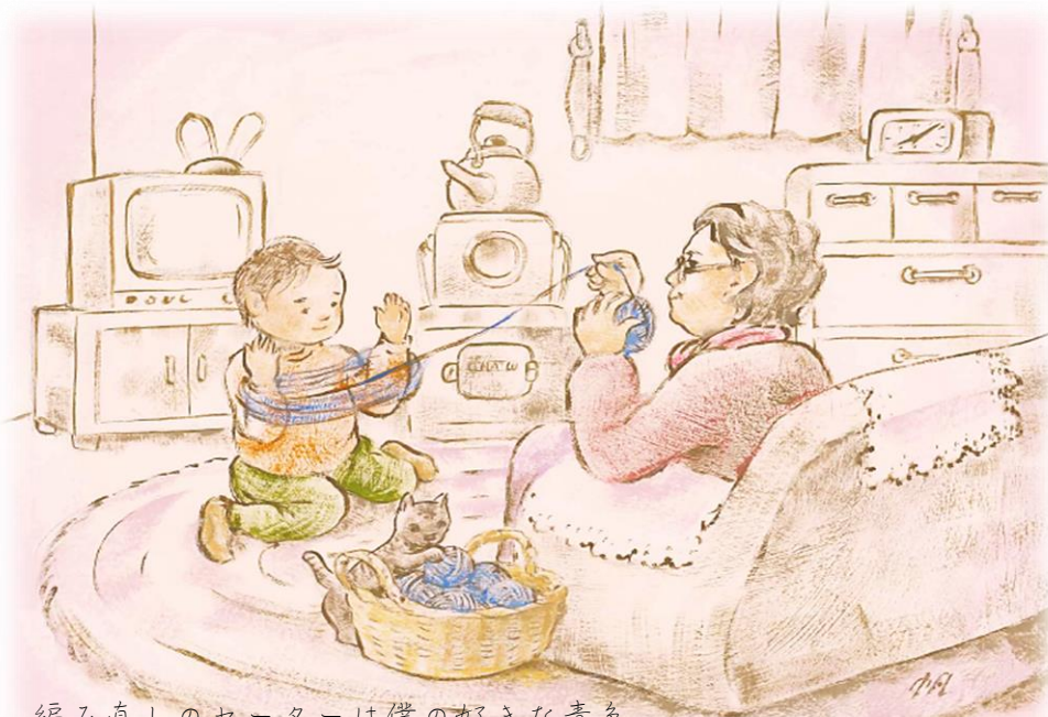
編み直しのセーターは僕の好きな青色 おばあちゃんの手、僕の手、そして猫の手 ひらい みほ